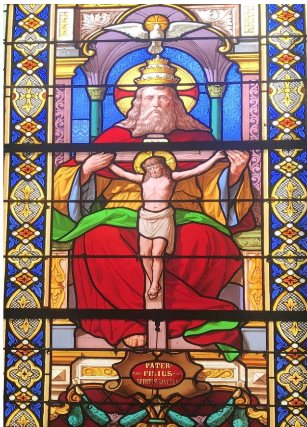
Vitrail Est de la sacristie – Eglise Saint Marc à Orléans