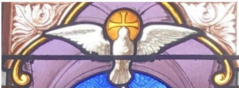
Esprit Saint du vitrail Est de la sacristie – Eglise Saint Marc à Orléans

Pas de monnaie ? Utilisez l’appli La Quête www.appli-laquete.fr